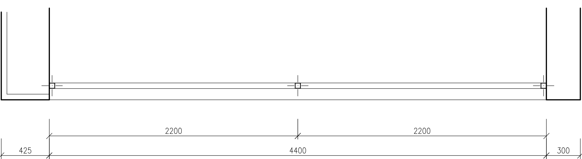
PŮDORYS BALKONU 1:20